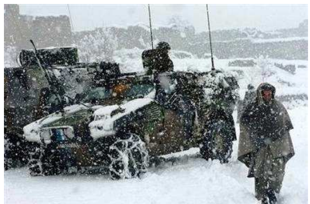
Soldats français en Afghanistan, le 7 janvier 2008