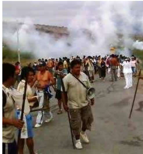
Résistance des peuples amazoniens au Pérou en juin 2009

Commission "Peuples autochtones" du CIIP