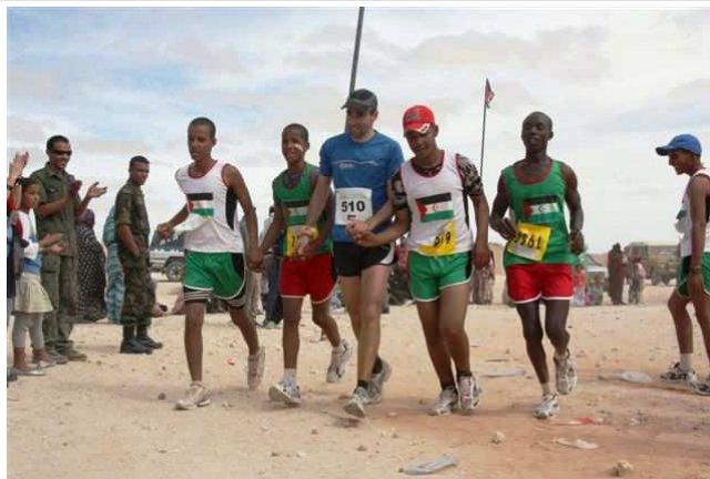
Sahara marathon 2010 : arrivée solidaire

Le secrétaire général du Front Polisario est le chef de l'État (3) , l'exécutif est constitué par le conseil des ministres et le conseil national sahraoui, assemblée