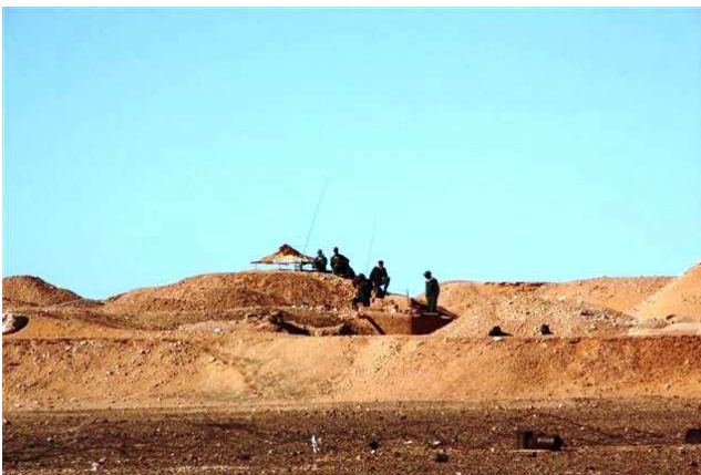
Le Mur avec un poste de guet

Alors quel espoir ? Lors d'une rencontre, l'ambassadeur sahraoui à Alger nous précise : la décolonisation passe automatiquement par le droit à l'autodétermination du peuple sahraoui. En interne, l'impact de la résistance des Sahraouis dans les territoires occupés est de plus en plus forte. En externe, la pression internationale de certains pays, notamment africains, s'accroît. A la question : « qu'attendez-vous de la France ? », il ajoute : tout d'abord qu'elle cesse d'imposer son veto à la demande de nombreux pays d'inclure les atteintes aux droits de l'Homme dans la mission de la Minurso. Par ailleurs, en tant que membre permanent du Conseil de Sécurité des Nations Unies, nous attendons tout simplement qu'elle fasse appliquer les résolutions votées...! La France ne peut prétendre favoriser la stabilité de la région si elle encourage la transgression du droit international, du droit des peuples et les Droits de l'Homme.