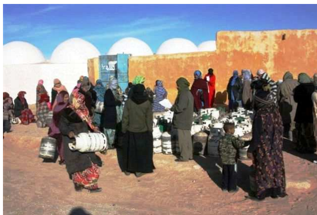
Distribution de bouteilles de gaz