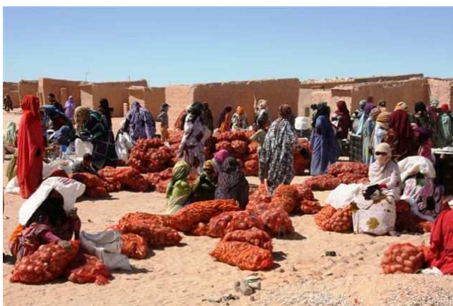
Distribution de nourriture

La vie s'égrène dans ce milieu hostile où règnent le sable, le vent, le soleil.