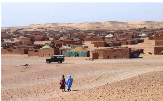
Camp de réfugiés

Grâce à la richesse halieutique au large du Sahara Occidental plus de 100 000 Marocains travaillent dans l'industrie de la pêche, principalement autour des ports de Dakhla et El Aaiun ; une grande majorité sont venus dans le territoire depuis l'occupation. Par ailleurs le Maroc vend des permis à des pays étrangers. L'Union Européenne et la Russie en sont les premiers bénéficiaires. L'accord signé en février 2007 entre l'UE et le Maroc stipule que 119 bateaux européens pourront pêcher dans les eaux marocaines et du Sahara Occidental. En échange, l'Union versera au Maroc, 36 millions € par an.